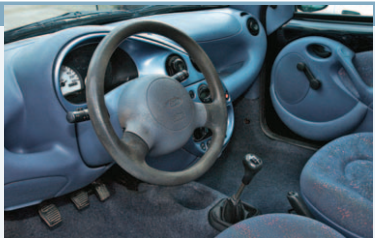
Salonas bjaurus: nutrintas vairas, iškilbusi pavarų perjungimo svirtis

MŪSŲ NUOMONĖ vienareikšmiška: tai atgyvenęs automobilis. Remontuoti jį neverta, o parengti kitai techninei apžiūrai bus paprasčiausiai per brangu. (Ir taip įvertinamas trylikos metų automobilis – red. pastaba.)