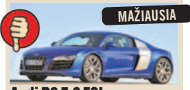
Audi R8 5.2 FSI maks. bagažinės tūris 100 l