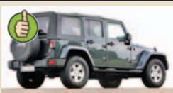
Jeep Wrangler Unlimited maks. bagažinės tūris 2600 l