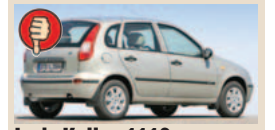
Lada Kalina 1119 maks. bagažinės tūris 600 l