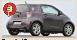
Toyota iQ maks. bagažinės tūris 238 l