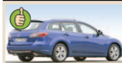
Mazda 6 (universalas) maks. bagažinės tūris 1751 l