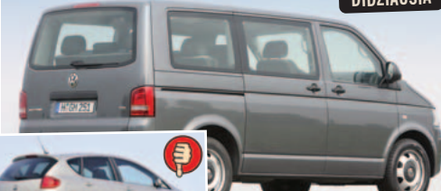
VW T5 Multivan maks. bagažinės tūris 4525 l