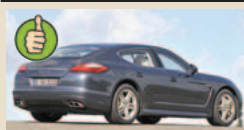
Porsche Panamera maks. bagažinės tūris 1263 l