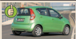
Suzuki Splash maks. bagažinės tūris 1050 l