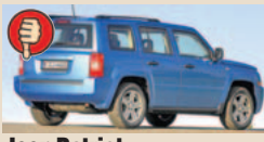
Jeep Patriot maks. bagažinės tūris 721 l