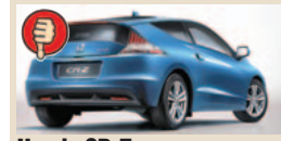
Honda CR-Z maks. bagažinės tūris 595 l