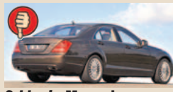
S klasės Mercedes maks. bagažinės tūris 560 l