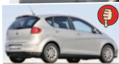
Seat Altea maks. bagažinės tūris 1320 l