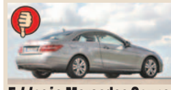
E klasės Mercedes Coupe maks. bagažinės tūris 450 l