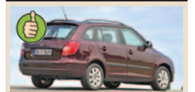
Škoda Fabia (universalas) maks. bagažinės tūris 1460 l