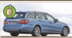
E klasės Mercedes (univers.) maks. bagažinės tūris 1950 l