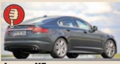
Jaguar XF maks. bagažinės tūris 540 l