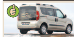
Fiat Doblo maks. bagažinės tūris 3200 l