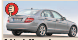
C klasės Mercedes maks. bagažinės tūris 475 l