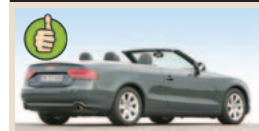
Audi A5 Cabrio maks. bagažinės tūris 750 l