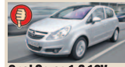
Opel Corsa 1.0 12V masė/galia 18,58 kg/AG