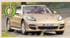
Porsche Panamera Turbo masė/galia 4,12 kg/AG