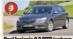
Opel Insignia 2.0 CDTI (univers.) masė/galia 15,45 kg/AG