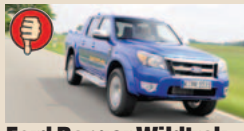
Ford Ranger Wildtrak masė/galia 12,92 kg/AG