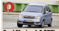
Opel Meriva 1.3 CDTI masė/galia 18,29 kg/AG