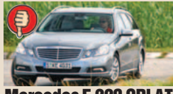
Mercedes E 220 CDI AT masė/galia 10,89 kg/AG