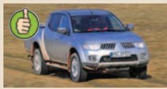
Mitsubishi L200 2.5 DI-D masė/galia 11,2 kg/AG