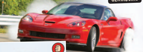
Corvette ZR1 masė/galia 2,37 kg/AG