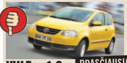
VW Fox 1.2 PRASČIAUSIAS masė/galia 19,45 kg/AG