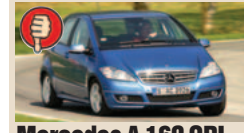
Mercedes A 160 CDI masė/galia 16,46 kg/AG