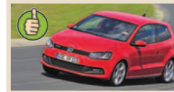
VW Polo 1.4 GTI masė/galia 6,88 kg/AG