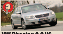
VW Phaeton 3.2 V6 masė/galia 9 kg/AG