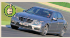
Mercedes E 63 AMG masė/galia 3,58 kg/AG