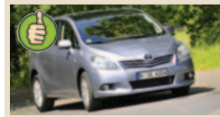
Toyota Verso 2.2 D-Cat masė/galia 9,18 kg/AG