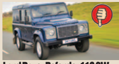
Land Rover Defender 110 SW masė/galia 17,79 kg/AG