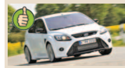
Ford Focus 2.5 RS masė/galia 4,86 kg/AG