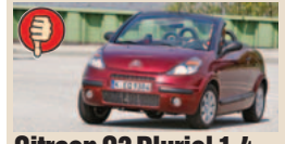
Citroen C3 Pluriel 1.4 masė/galia 16,16 kg/AG