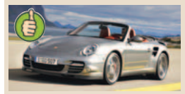
Porsche 911 Turbo masė/galia 3,34 kg/AG