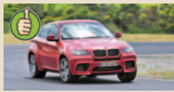
BMW X6 M masė/galia 4,21 kg/AG