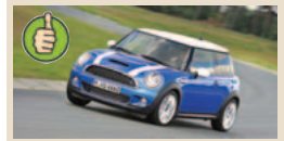
Mini Cooper S masė/galia 6,48 kg/AG