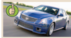
Cadillac CTS-V masė/galia 3,42 kg/AG